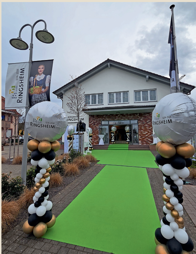
Spektakulärer Empfang der Gäste