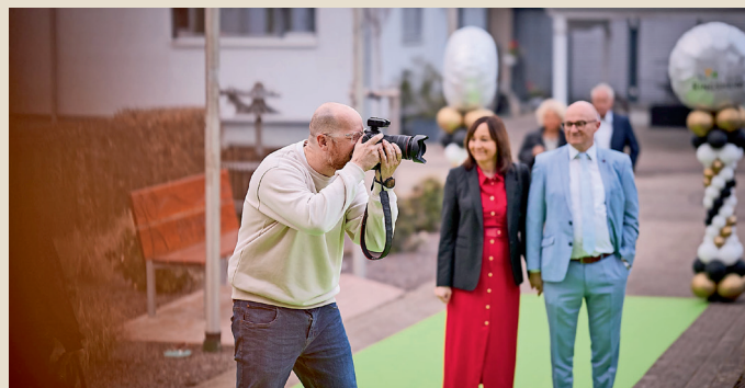
Fotograph Christoph Nadler in Action