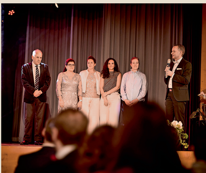
Dank an das Organisationskomitee des Jubiläums