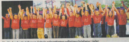
Die Kinder der Karl-Person-Schule präsentierten selbstgeschriebene Lieder.

Kulinarisch begann der Abend mit einer Wildschwein-Terrine mit einer Kartoffel-Lauch-Creme und Zwiebelküchle mit „Rings-Auflacht“ aus Erbsen, Bohnen und Linsen. Als Hauptgang wurde Röhrlinchen mit Wurzelgemüse, Kartoffelgratin und Schwarzwurzelpüree serviert. Das Menü erledete mit einem Dessertbuffet aus süßen Variationen im Glas sowie einer Auswahl erlesener Käsesorten. Alle Speisen wurden von der Metzgerei Tischler zubereitet.