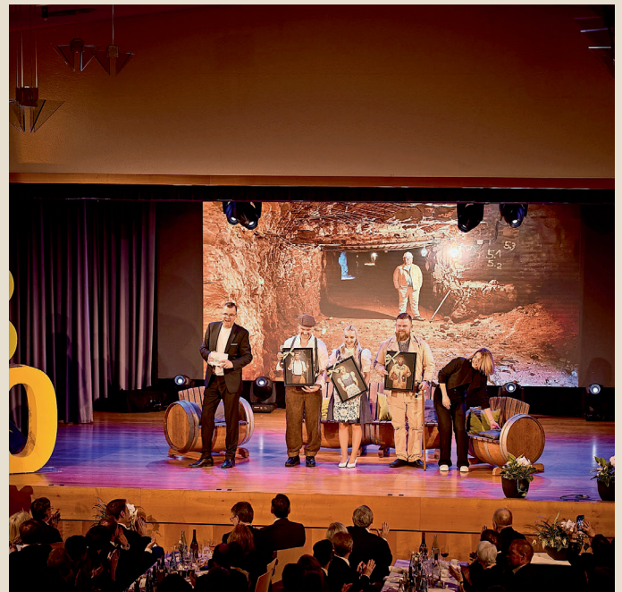
Talkrunde mit den „Ringsheim Models“ – Einblicke in ihre Erfahrungen der letzten Monate