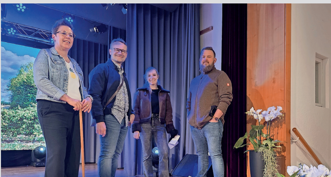
Die „Ringsheim Models“ besprechen die letzten Abläufe