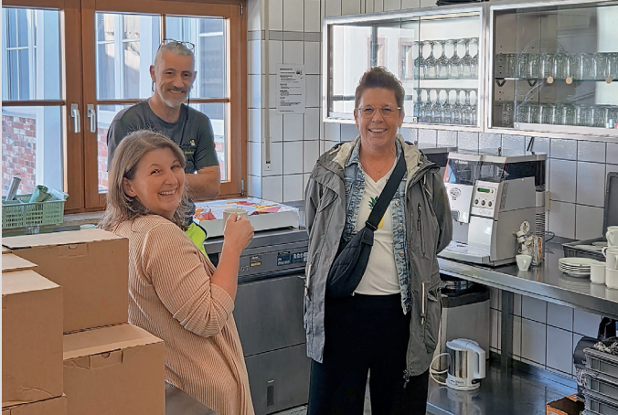
Lagebesprechung der Organisatoren