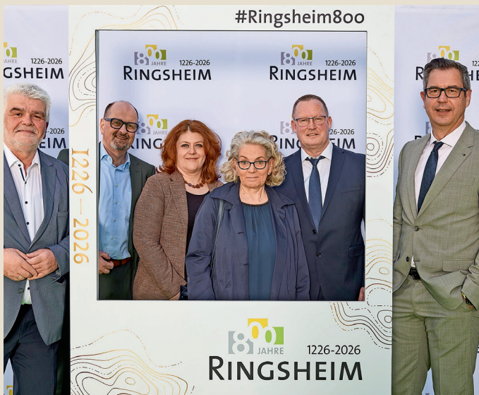
Die Gäste der Firma Simona-Hauptsponsor des Jubiläumsjahres