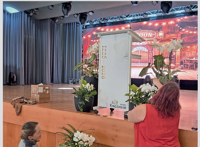
„Team Grün“ des Bauhofs im Einsatz