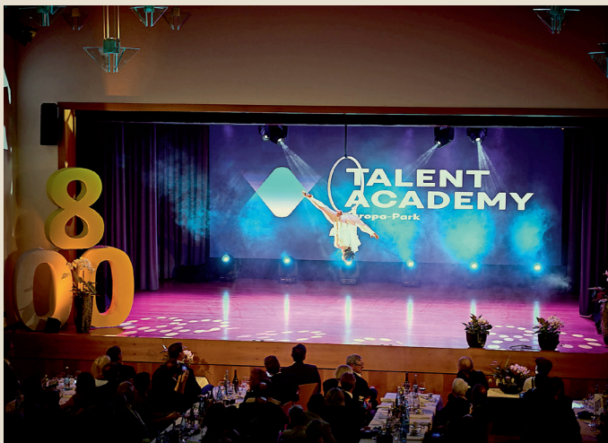
Magische Momente beim Akrobatikauftritt der Künstlerin der Talent Academy des Europa-Parks