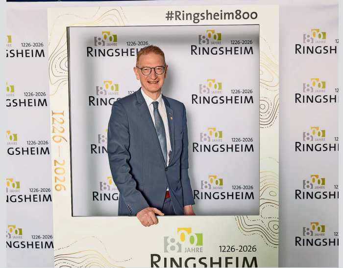
Bürgermeister der Stadt Herbolzheim Thomas Gedemer