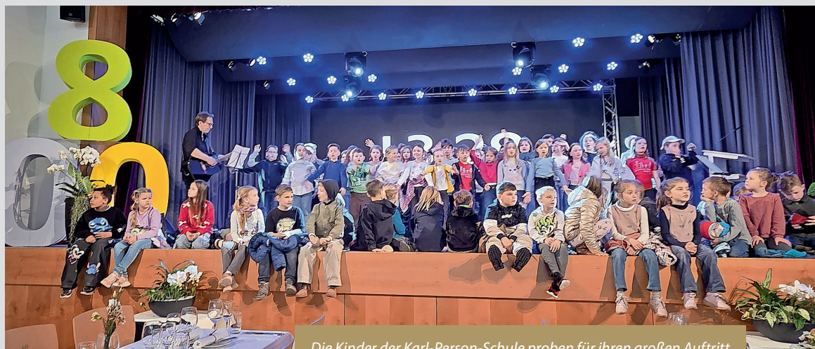
Die Kinder der Karl-Person-Schule proben für ihren großen Auftritt