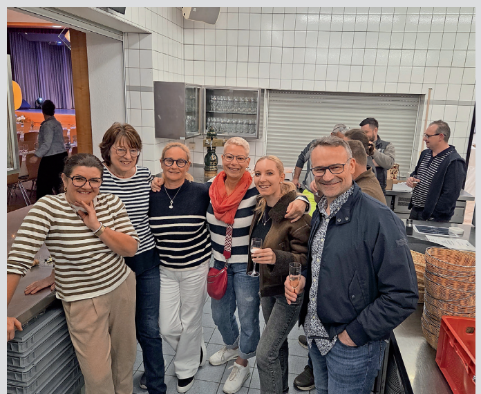
Gemütliches Beisammensein nach getaner Arbeit