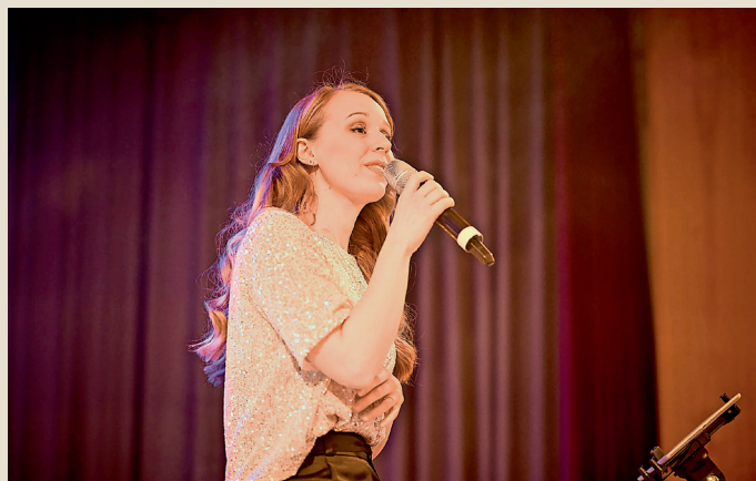
„L'Hymne d'Amour“ als Bezug zur Partnergemeinde Albigny