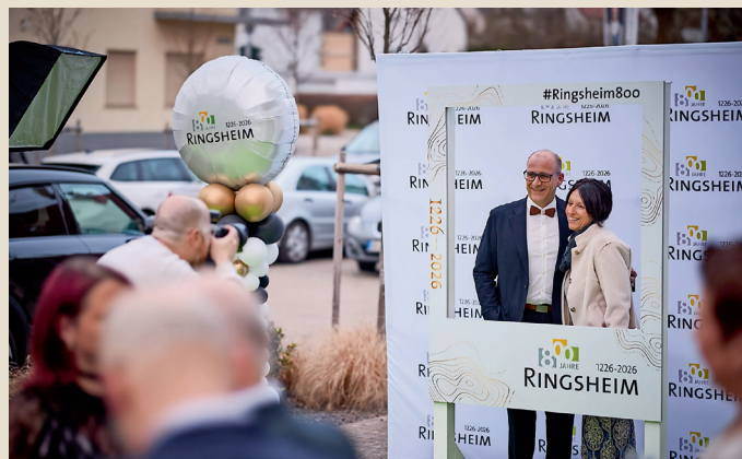
Erinnerungen werden an der Fotowand festgehalten