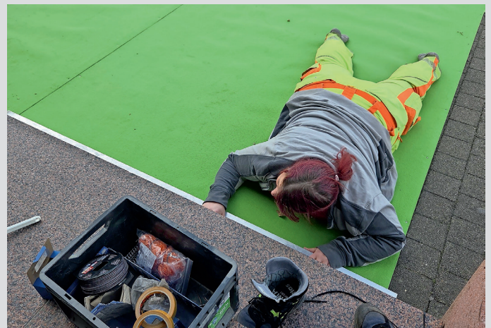
Voller Körpereinsatz am Grünen Teppich