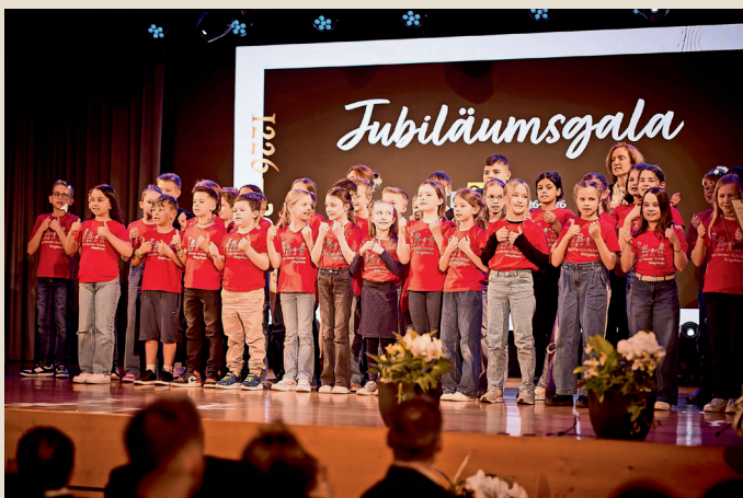
Mit zwei Liedern erfreuten die Kinder das Publikum.