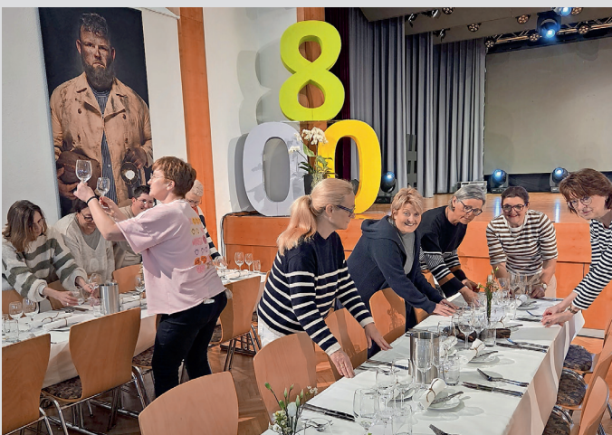
Fleißige Helfer beim Dekorieren der Festtafel