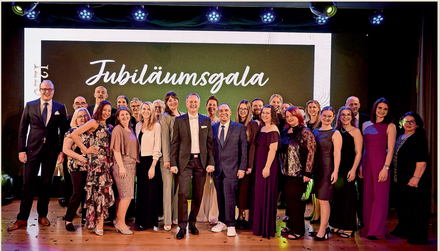
Mitarbeiter der Gemeinde Ringsheim